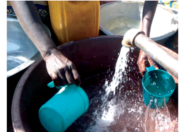
Grundlage für ein gesundes Leben: Sauberes Wasser.