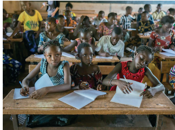
Eine schulische Ausbildung ist wichtig für alle Kinder.

Behörde für Arbeit, Soziales, Familie und Integration